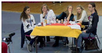
Jury de la critique lycéenne - 26 èmes RLV 2014

A la suite et à huis-clos, les membres de ce jury désignent un film auquel ils remettront le « Prix du jury de la Critique Lycéenne » lors de la soirée de clôture.